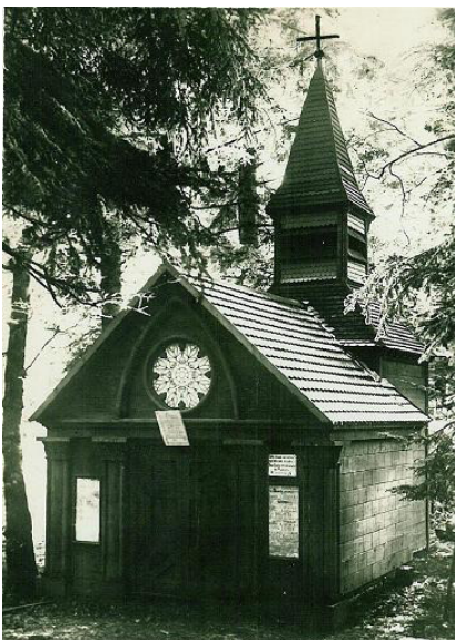
La Chapelle Sicurani dans les années 1920