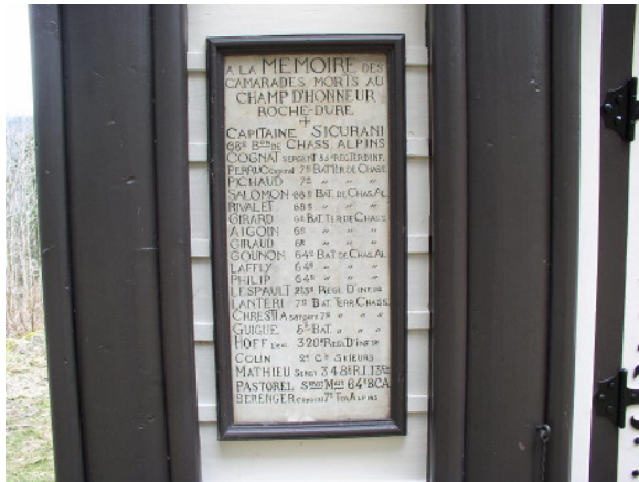
Inscription de gauche