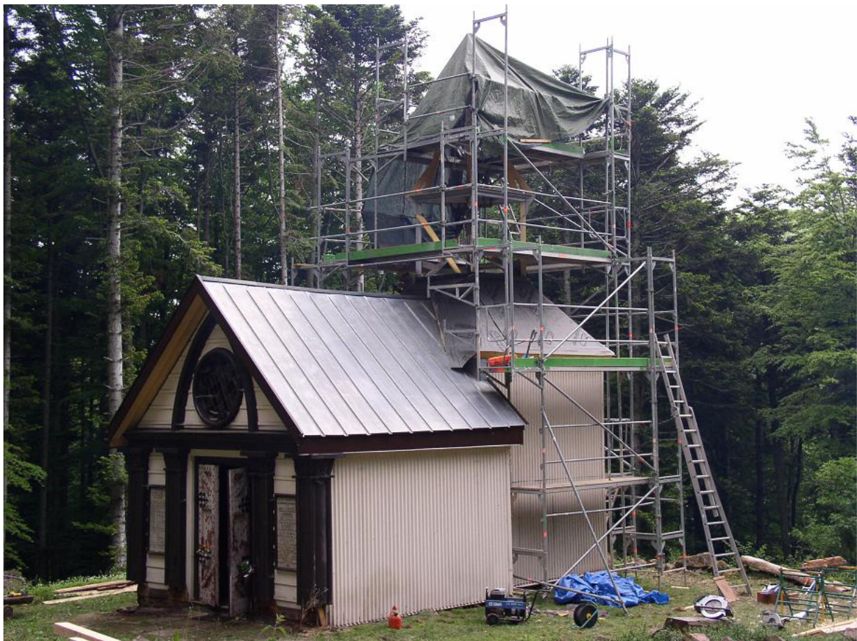
La Chapelle Sicurani en cours de restauration en 2007