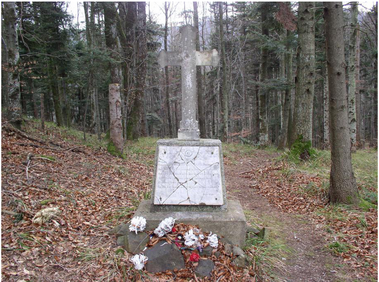
Calvaire à l'emplacement du cimetière Sicurani

Et comme ferait une mère, la voix d'un peuple entier la berme en leur tombeau. (Victor Hugo.)